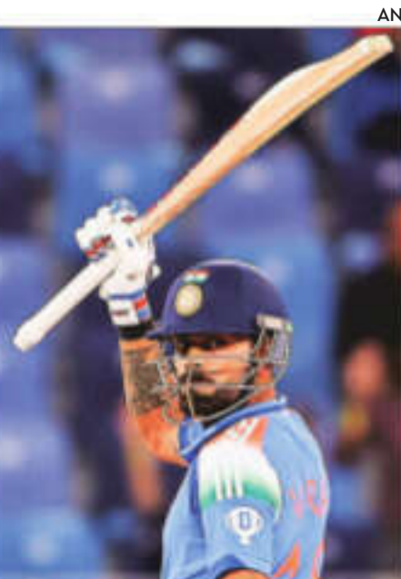
(Left) KL Rahul and Ravindra Jadeja celebrate after winning against Australia during the ICC Champions Trophy semifinal in Dubai on Tuesday; Virat Kohli (above) celebrates his half-century

Player of the match Kohli (84, 98 balls, 5x4) was the fulcrum of Indian batting as they scaled down 265 in 48.1 overs after Steve Smith (73) and Alex Carey (61) led the Aussies to 264. Now, India will await the winner of the second semifinal between South Africa and New Zealand at Lahore on Wednesday.