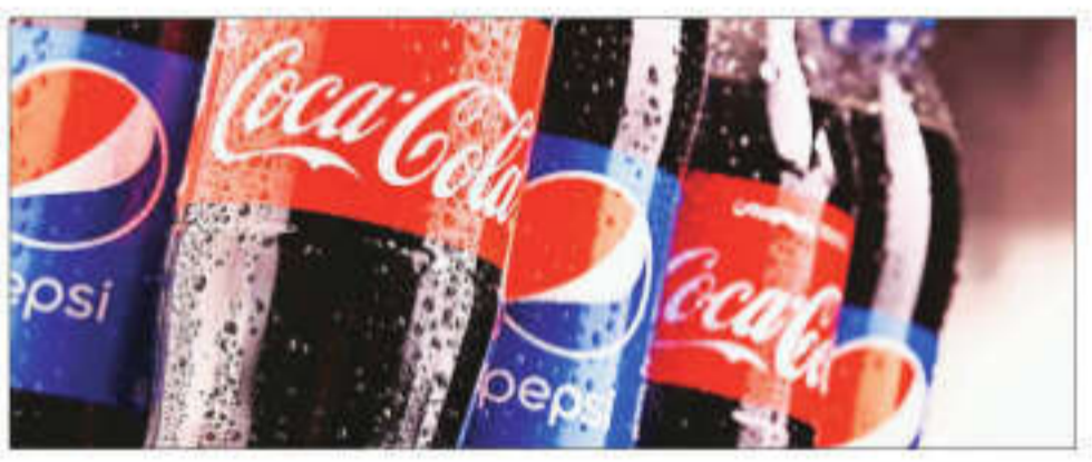
Replying to Coca-Cola's 'half time' campaign for the Champions Trophy 2025, PepsiCo came out with a full-page newspaper advertisement flipping the script with 'any time' campaign

THE NEVER-ENDING HILARIOUS ad war between beverage majors Coca-Cola and PepsiCo has taken off this season with PepsiCo's jibe at its arch rival Coca-Cola's campaign. Replying to arch rival Coca-Cola's 'half time' campaign for the ICC Champions Trophy 2025, PepsiCo came out with a full-page newspaper advertisement flipping the script with 'any time' campaign with a direct hit on the cola major trying to grab the consumers' eyeball.